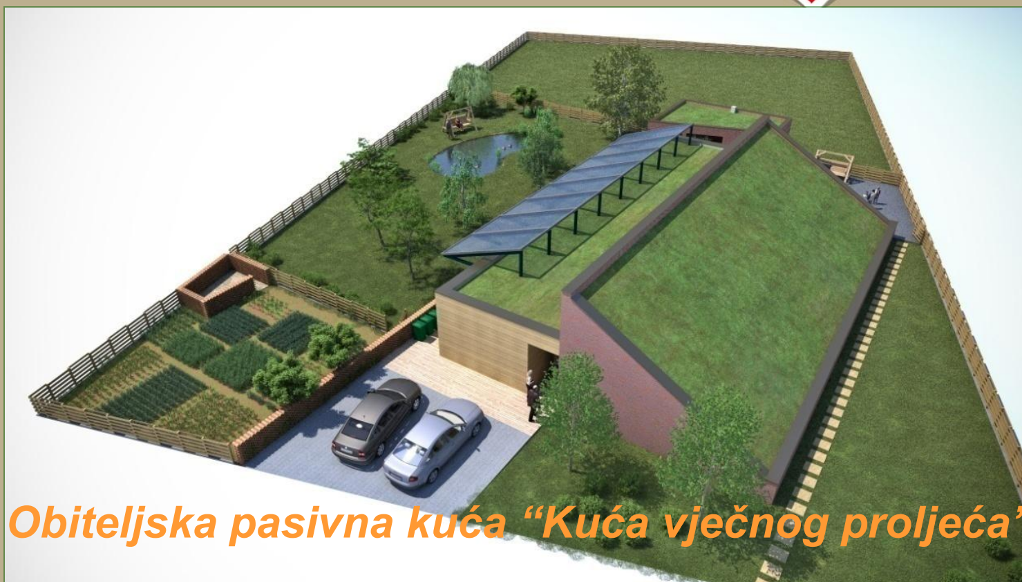
Obiteljska pasivna kuća “Kuća vječnog proljeća”