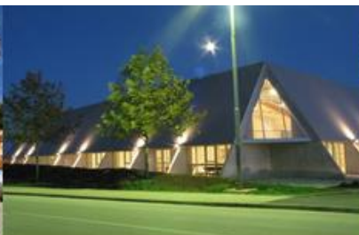
Sportska dvorana Umag