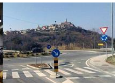
Kružni tok Buje