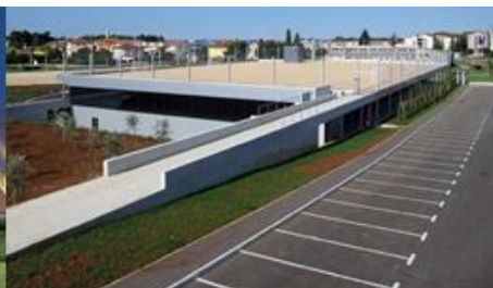
Sportska dvorana Novigrad